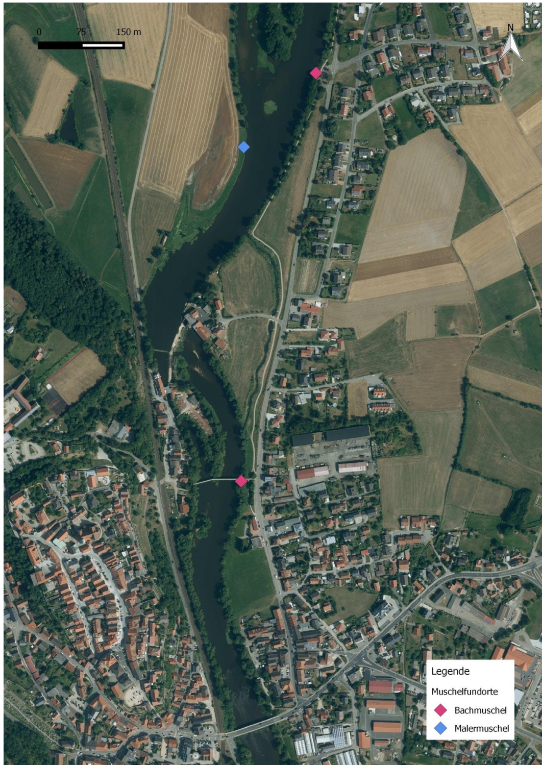
Abb. 1: Verbringungsorte für Muscheln (Maßnahme 4 V)